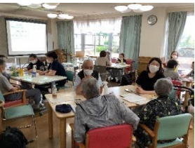
《つどい隊》 [↑] フリーコーナー

◎皆様、ご参加頂きありがとうございました！ お疲れ様でした!! 【おひさまカフェ事務局一同】